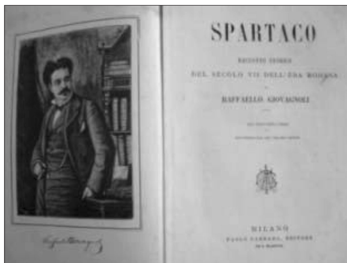
ROMANZO DI RAFFAELLO GIOVAGNOLI

Nel suo romanzo, Spartaco, ottenuta la libertà dal popolo e da Silla, dopo una sua vittoria nel circo, si mette a capo della cospirazione e poi della rivolta degli schiavi con-