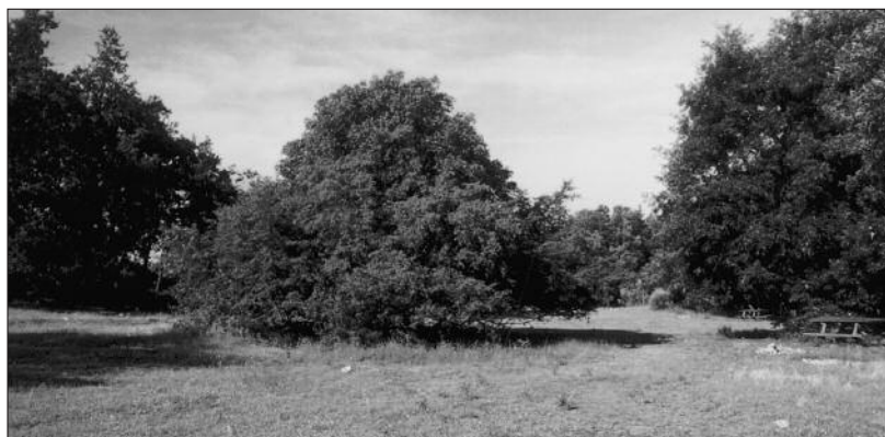
Fig. 3 - LOCALITÀ "PIAZZA DI SPAGNA" ALL'INGRESSO DELLA RISERVA IN CORRISPONDENZA DI VIA REATINA PRESSO MENTANA; PARTICOLARE DEL PRATO CON UN GRANDE CARPINO ( CARPINUS? SP. ) AL CENTRO