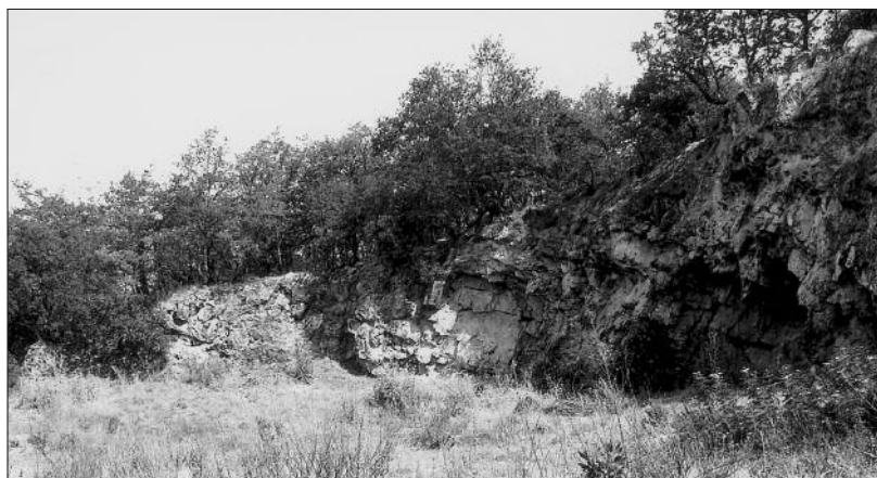
Fig. 2 - LOCALITÀ LA CAVA PRESSO MACCHIA DEL BARCO; PARTICOLARE DELLE BANCATE DI CALCARE TRAVERTINOSO