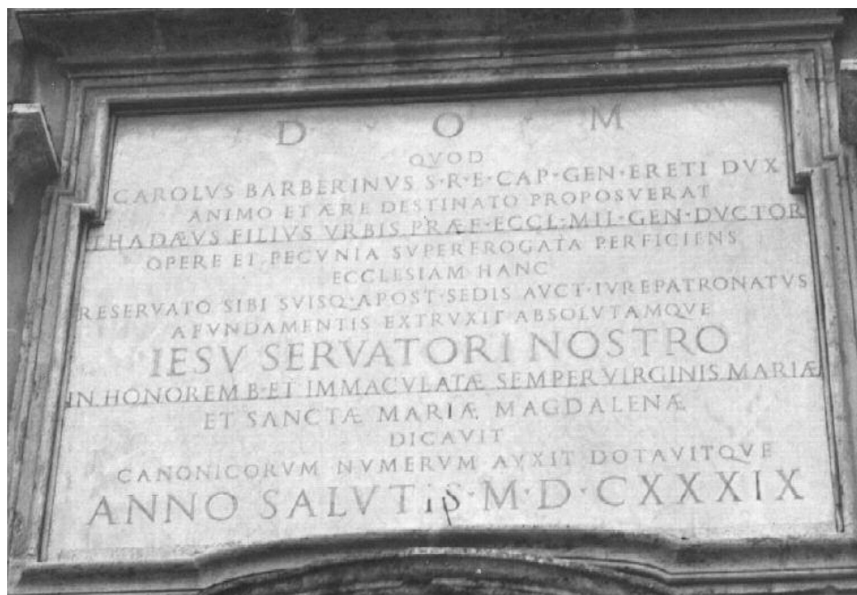
Fig. 4 – ISCRIZIONE DEL 1639 SULLA FACCIATA DEL DUOMO, RELATIVA ALLA COSTRUZIONE DEL MEDESIMO

In attesa di approfondire in un'altra occasione l'analisi dei testi presentati in questo contributo, possiamo concludere sottolineando innanzitutto l'importanza della figura del Pontefice Urbano VIII, nonché della sua famiglia, i Barberini, che traspare da alcune delle iscrizioni esaminate (la prima, la quarta e, forse, la seconda). Si tratta infatti di un pontefice il cui casato è diretta-