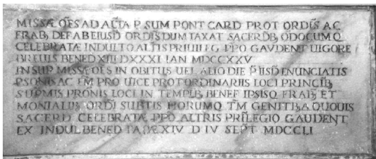
Fig. 2 – ISCRIZIONE DEL 1751 DALLA CHIESA S. MARIA DELLE GRAZIE

Tutte le messe per il Sommo Pontefice Cardinale protettore dell'ordine e per i fratelli defunti in qualunque tempo celebrate agli altari esclusivamente da sacerdoti del medesimo ordine per indulto godono del privilegio perpetuo dell'altare