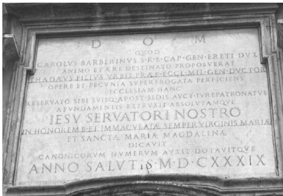
Fig. 4 – ISCRIZIONE DEL 1639 SULLA FACCIATA DEL DUOMO, RELATIVA ALLA COSTRUZIONE DEL MEDESIMO

In attesa di approfondire in un'altra occasione l'analisi dei testi presentati in questo contributo, possiamo concludere sottolineando innanzitutto l'importanza della figura del Pontefice Urbano VIII, nonché della sua famiglia, i Barberini, che traspare da alcune delle iscrizioni esaminate (la prima, la quarta e, forse, la seconda). Si tratta infatti di un pontefice il cui casato è diretta-