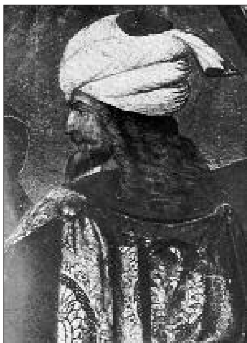
GIOVANNI BORGIA, DUCE DI GANDIA