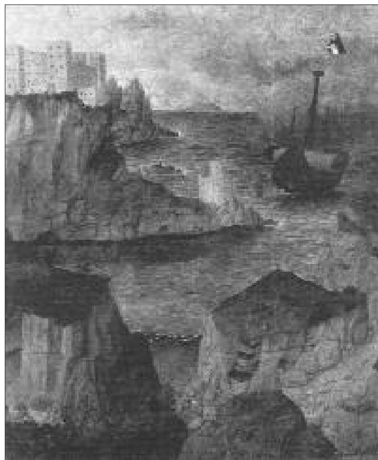
COLANTONIO, S. VINCENZO FERRER SALVA UNA NAVE DAL NAUFRAGIO

Da quanto si evince dalle citate visite pastorali, la vita spirituale a Nerola, all'epoca dei Borgia, era molto fervorosa proprio per opera dei padri predicatori domenicani che con l'introduzione delle Confraternite sostenevano ed incoraggiavano la pietà popolare non solo con il raccoglimento e la preghiera ma anche con concrete opere di carità 39 .