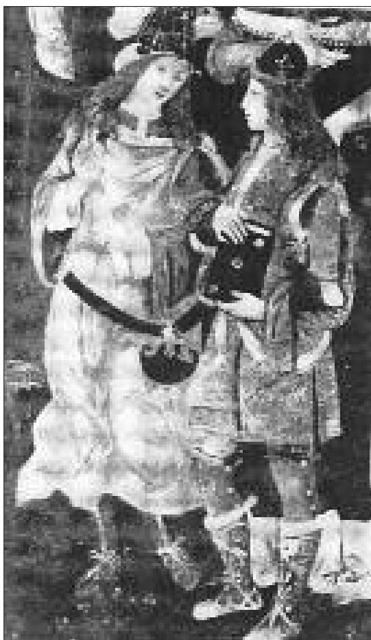
GOFFREDO BORGIA E SANCIA D'ARAGONA

Era chiaro che dalla rovina di costoro essi non avrebbero ricavato altro che la propria rovina. Francesco Orsini conte di Nerola e Paolo Orsini signore 30 di Palombara e Mentana non potevano dimenticare le lotte scatenate dal papa contro la loro famiglia e