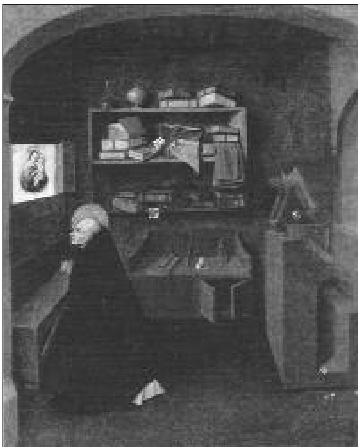
COLANTONIO, APPARIZIONE DELLA VERGINE A S. VINCENZO FERRER NELLA SUA CELLA - NAPOLI, MUSEO DI CAPODIMONTE

Fra le altre significative iniziative pastorali di Alessandro VI, ci fu il ripristino del suono dell'"Angelus", ancora in vigore in tutta la cristianità.