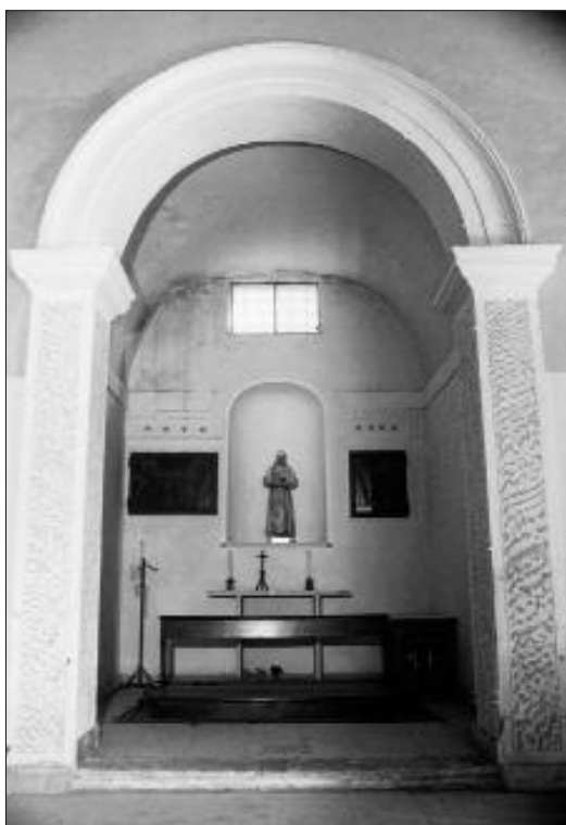
CAPPELLA DI DX, GIÀ DEDICATA A S. ANTONIO DA PADOVA

La vita e l'attività della piccola comunità francescana di Mentana iniziò così il suo cammino, perfettamente inte-