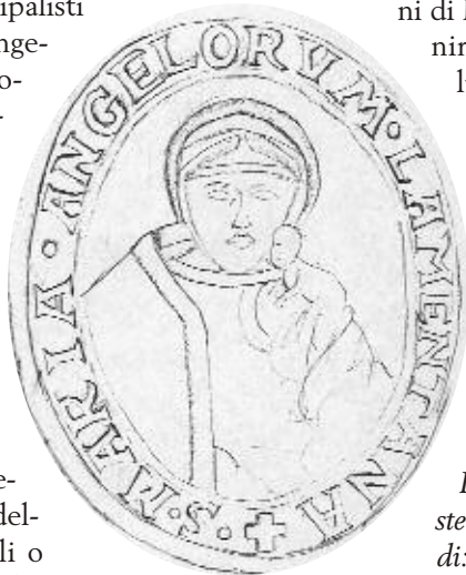
SIGILLO DEL CONVENTO (RICOSTRUZIONE)