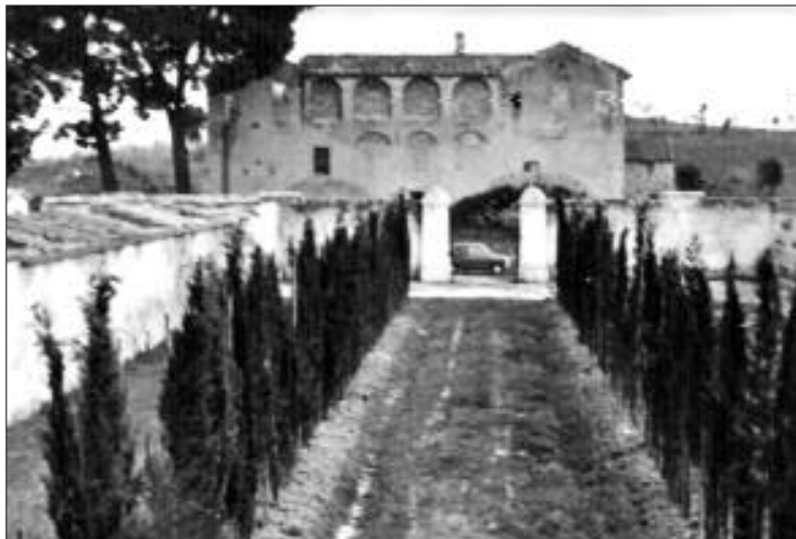
VEDUTA DEL CONVENTO DAL VIALE DEL MAUSOLEO ZWOBADA. CAMPOSANTO DI MENTANA (da VICARIO, ZWOBADA A MENTANA, p. 173)

L'istanza venne accolta e il convento venne provvisoriamente affidato al comune. La Direzione generale dell'Amministrazione dei Fondi del culto, tuttavia, considerando che in questo modo gran parte dei locali del convento sarebbero rimasti inutilizzati, come pure non avrebbe potuto in parte frazionarsi il terreno cinto da mura, d'ac-