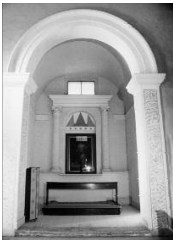
CAPPELLA DI SX, GIÀ DEL CROCEFISSO

Sul frontale della mensa in marmo dell'altare della cap-