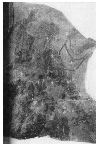
CAPPELLA DI SX, FRAMMENTO DI AFFRESCO

La prima di queste epigrafi, disposta sopra la marmorea pila dell'acqua santa, nella parte destra nell'entrare in chiesa, in una lapide di marmo "colorita" per ricordare la consacrazione della Chiesa, vi si leggeva: