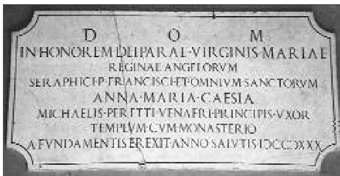
LAPIDE DEDICATORIA

Ma a partire da quel 1696, la Confraternita che intanto