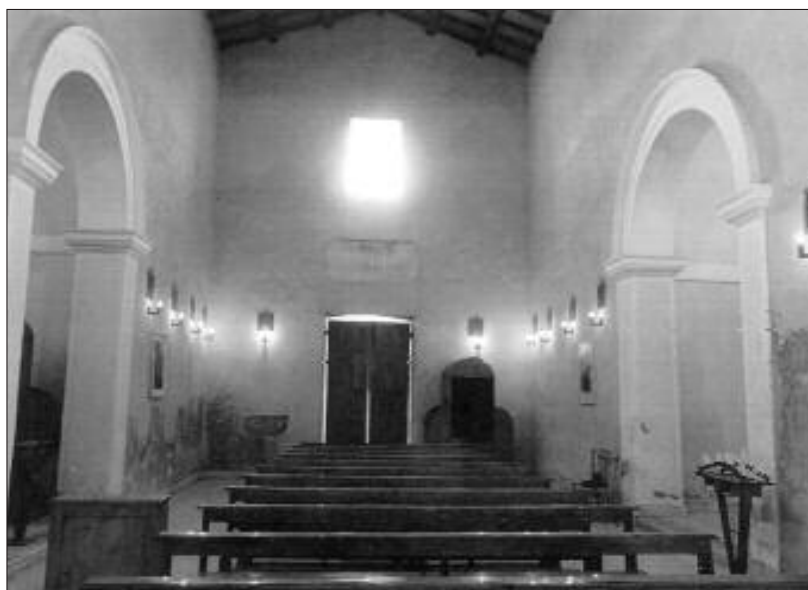
LA CHIESA, INTERNO

tunati calzolaio in Piazza di Spagna...che con dette sacrileghe compre... ha mutato condizione...tiene una vita assai comoda e facoltosa, ritenendo perfino una polita carrettella con buoni cavalli...". Ma tutto fu vano 15 .