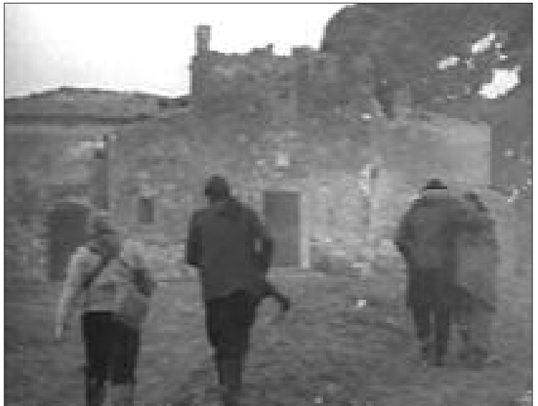
PROSPETTO DELLA CHIESA (1961), A SINISTRA LA VEDUTA DELL'INGRESSO AL CONVENTO (DAL FILM "IL RE DI POGGIOREALE", REGIA D. COLETTI)

L'impianto interno è a navata unica, con copertura a capriate, ed anch'esso, come le altre chiese coeve, presenta un gradino che mette in comunicazione la navata con il presbitero rialzato. Attualmente, dopo i restauri degli anni