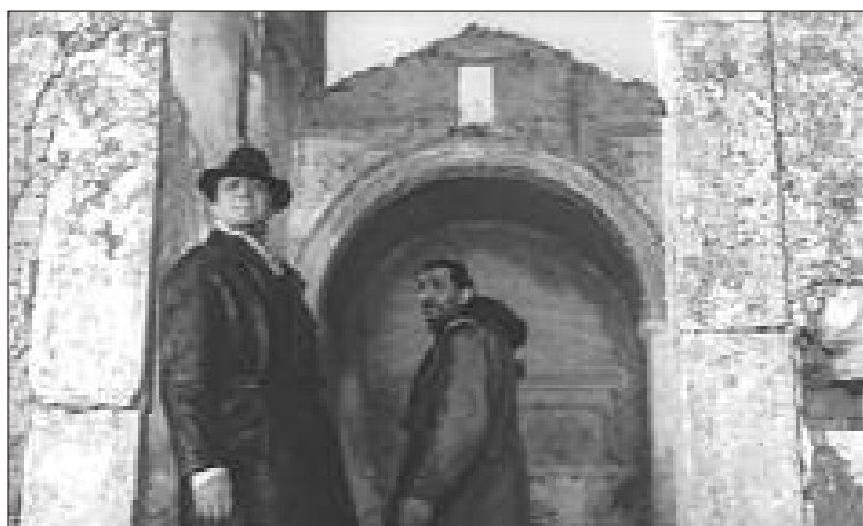
INTERNO DELLA CHIESA (1961) (DAL FILM "IL RE DI POGGIOREALE", REGIA D. COLETTI)

Nel 1810 si ordinò la soppressione di tutti gli ordini religiosi, con un editto firmato da Napoleone a Compiègne il 25 aprile: il decreto sopprimeva tutti gli ordini e le Congregazioni religiose eccetto gli ospitalieri e le suore di carità. Subito i delegati statali apposero i sigilli e i sequestri