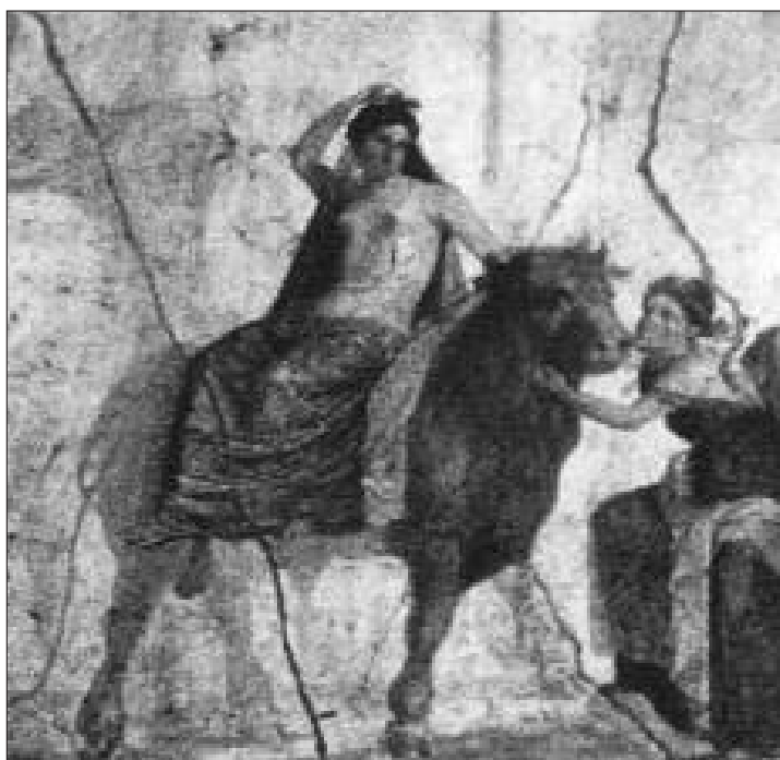
EUROPA E IL TORO (da: Le Collezioni... pag. 47)

Narra la leggenda che Zeus, invaghitosi della bella Europa, figlia del re di Tiro, si trasformò in un bellissimo Toro, e, portatosi sulla spiaggia ove ella era solita passeggiare, si mostrò così mansueto che la fanciulla gli sali in groppa. A questo punto Zeus-Toro attraversò il mare e portò Europa nell'isola di Creta,