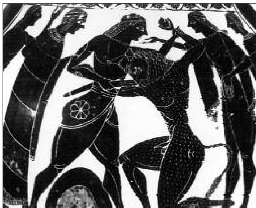
TESEO UCCIDE IL MINOTAURO (da: Boardman, p. 73, fig. 66,2)

Tale aspetto si evidenzia nel mito quando Poseidone, proseguendo la sua vendetta, fa