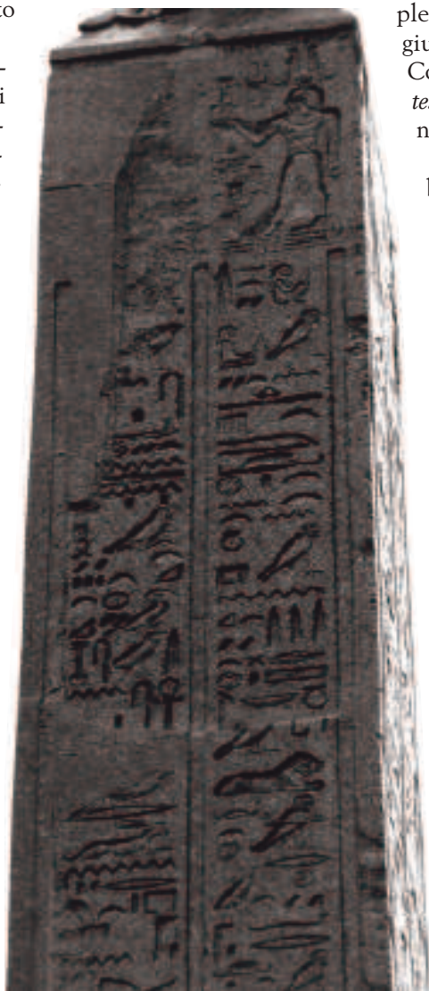
LATO I. MENZIONE DELLA DEDICA DEL TEMPIO AD ANTINOO. È VISIBILE IL TERMINE h3-Rw m'

È nota la costante presenza dell'imperatore alle esercitazioni degli Equites , sia nel corso dei propri viaggi che a Roma, tanto che lo stesso Adriano rinnovò i regolamenti per le esercitazioni a cavallo 38 .