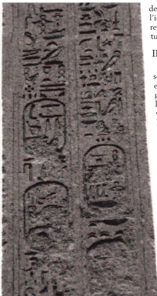
LATO IV. ISCRIZIONE DEDICATORIA CON CARTIGLI DELL'IMPERATRICE SABINA

Ad esempio quanto sostenuto da Mari a proposito della sepoltura di Antinoo a Villa Adriana si basa sulla seguente traduzione: [...] ( Osiride Antinoo ) che è tra i giusti nell'aldilà, riposa in questa tomba posta all'interno del giardino nel-