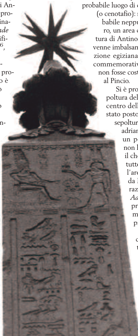
LATO II. PARTICOLARE CON ADRIANO ED AMON RA