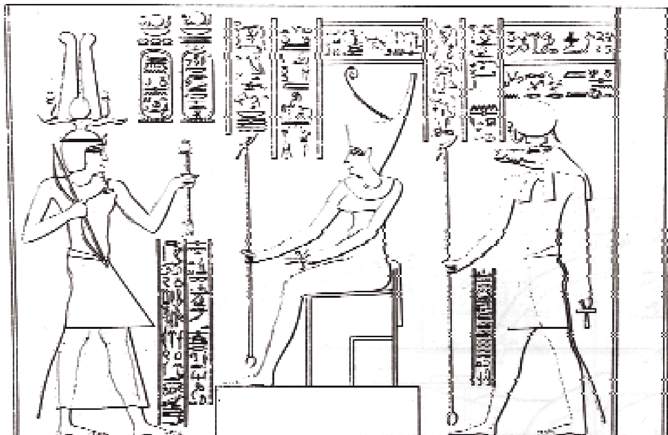
ADRIANO COME FARAONE. TEMPIO DI ESNA. RILIEVO INIZIATO SOTTO ADRIANO E TERMINATO DA ANTONINO PIO (DA CHAMPOLLION)