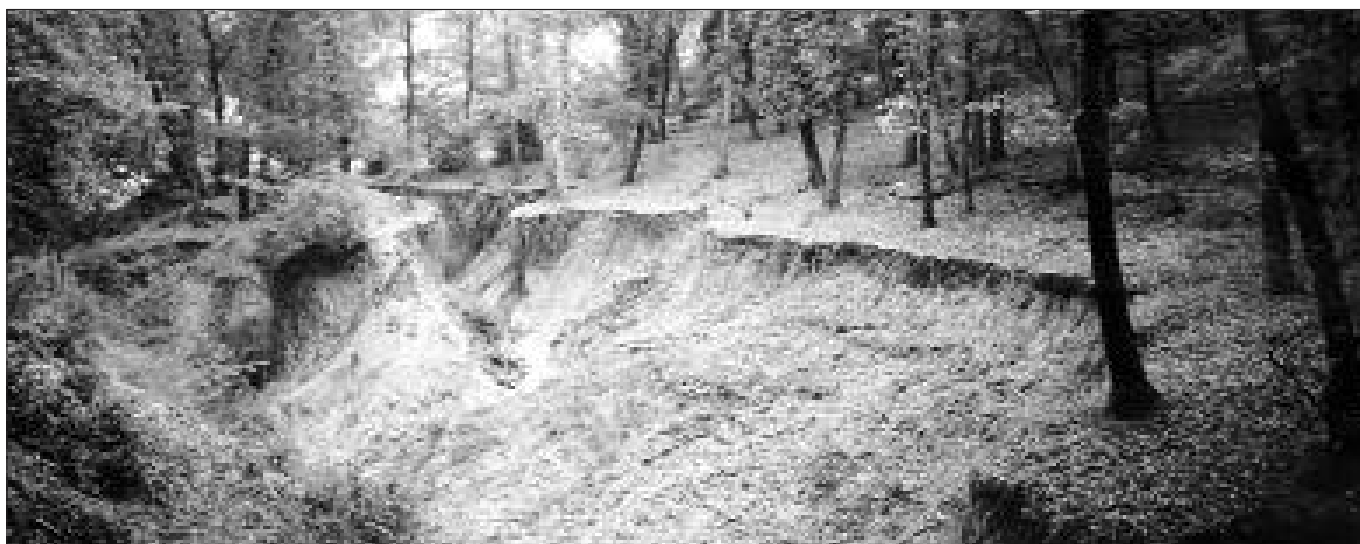
Fig. 2 – IL “BOSCO TRENTANI”. FOSSO TRENTANI: MANIFESTAZIONI EROSIVE

e Sympetrum Newmann, 1833 (15.VI.1997 h 10:00, 21.IX.1997 e 21.X.2001).