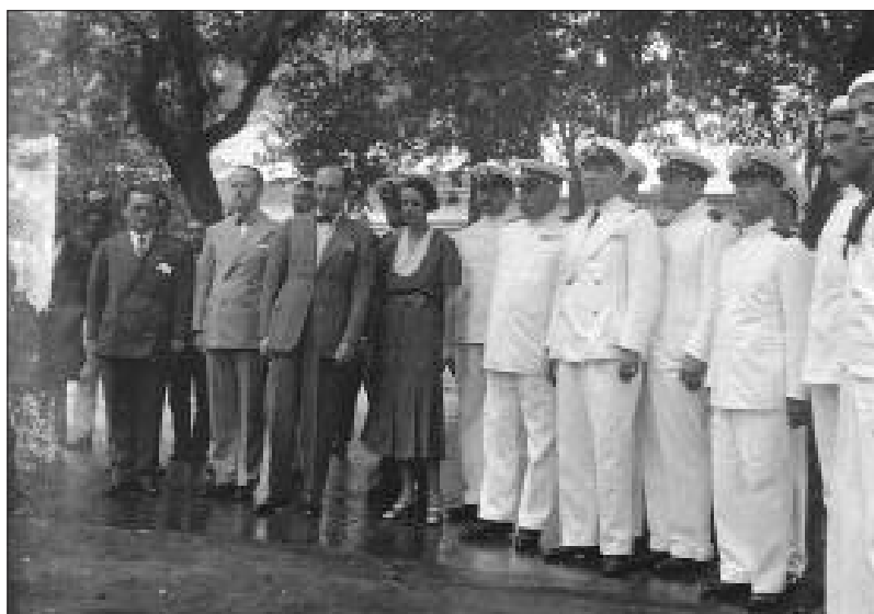
L'EQUIPAGGIO DEL "VULCANIA" DEPOSITA UNA CORONA DI FIORI SUL MONUMENTO A CARLO DEL PRETE CON L'INTERVENTO DELL'AMBASCiatore CONTALUPO E SIGNORA - RIO DE JANEIRO, 6 MARZO 1933

ogni "conoscitore di storia dell'arte": non si può parlare "di opere d'arte, senza un'adeguata preparazione, senza cioè avere educato l'occhio alla lettura del fatto figurativo" 5 – ha trattato Il ciclo decorativo del castello di Marco Simone , Il programma celebrativo delle famiglie Tebaldi e Cesi . Dopo avere collocato nel tempo le fasi costruttive del castello, con una analisi critica estremamente convincente, passa a suddividere i cicli pittorici riferibili alla famiglia Tebaldi, della quale imposta pure la sequenza dei personaggi che si sono susseguiti nella proprietà, assegnandone e attribuendone anche i cicli decorativi 6 , da quelli riferibili alla famiglia Cesi: e il contributo riferito a questa famiglia è sempre puntuale, stringente e documentato.