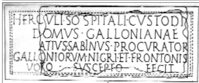
Y - Fig. 1 -

[Her]culi Sospitali, Custodi [d]omus Gallonianae, [- - -]atius Sabinus, procurator [Gall]oniorum Nigri et Frontonis, 5 [vot]o suscepto, fecit.