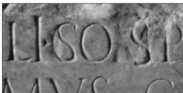
Y - Fig. 2 -

Senza allontanarci eccessivamente nel tempo, possiamo soffermarci sul primo personaggio di rilievo noto di tale nome,