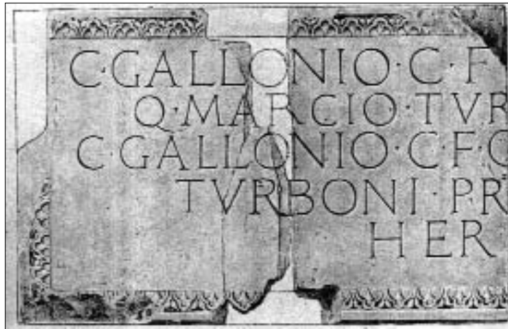
Ÿ – Fig. 3 –

Figli adottivi di questo sono considerati due individui, che recano i suoi stessi elementi onomastici ed in un caso anche il gentilizio Gallonius, ovvero T. Flavius T. f. Pal. Priscus Gallonius Fronto Marcius Turbo e T. Flavius T. f. Pal. Longinus Q. Marcius Turbo, l'uno appartenente all'ordine equestre, l'altro senatore e console verso il 149 d.C.