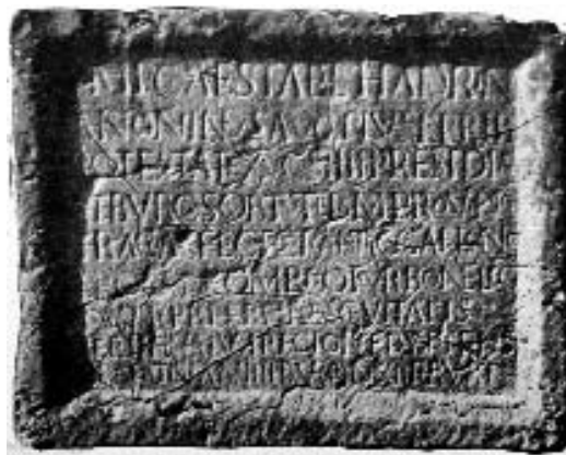
Ÿ – Fig. 4 –

A quanto detto si aggiunga qualche considerazione in merito al tipo di monumento cui poteva appartenere la dedica in esame. La lastra, che, integra, raggiungeva le dimensioni di ca. 80 cm di lar-