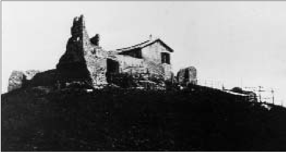
CASTRUM DI MONTE GENTILE

tiburtina) ci si rende conto che questo fenomeno interessò soprattutto le zone di più alto valore strategico, come quelle verso Roma, ove l'insediamento sparso era rimasto dominante fin dall'alto medioevo e cominciava a costituire nel Due-Trecento un problema 124 .