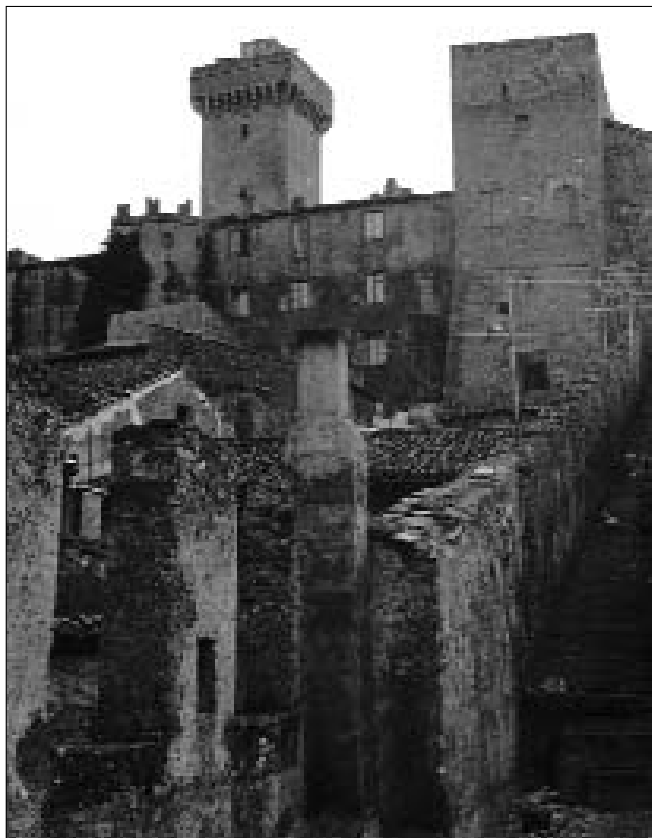
PALOMBARA SABINA. IL CASTELLO SAVELLI (PARTICOLARE)

Il reticolo delle strade secondarie invece non ricalca in alcun modo i percorsi antichi. Esso è creato dalla necessità immediata di garantire ad ogni coltivatore l'accesso diretto al proprio fondo senza passare attraverso le proprietà altrui, possibilità che era fortemente vietata nel tiburtino come in altre zone della regione laziale del resto 56 . Le dimensioni delle strade sono piuttosto ridotte e manca una materiale diversificazione della rete viaria: essa si può definire come un intreccio di stradine e viottoli campestri, dove pochi sono gli assi di maggiori di-