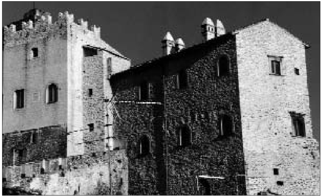
PALOMBARA SABINA. PARTICOLARE DEL CASTELLO SAVELLI

In questa sommaria ricostruzione storiografica delle ricerche storiche sull'area tiburtina è possibile notare che sebbene tutte o quasi facciano riferimento più o meno direttamente al saggio pionieristico di Toubert, esse presentano comunque tipologie diverse. Sono di carattere archeologico gli studi di C. Wickham 27 , che negli anni '80, parallelamente ad un certo sviluppo dell'archeologia rurale, proponeva un'interpretazione