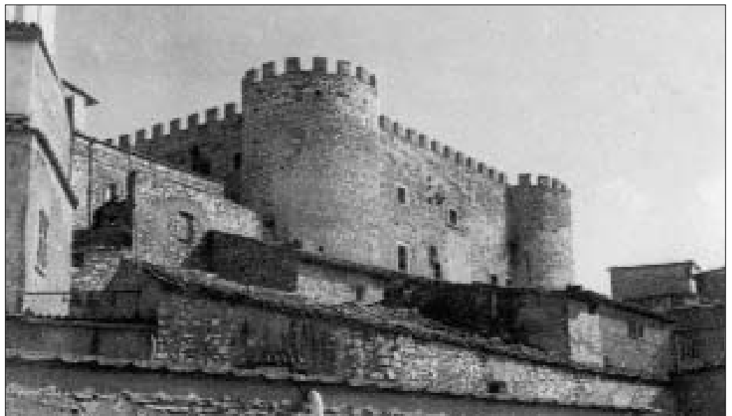
IL CASTELLO "ORSINI-CESI" DI S. ANGELO ROMANO

Nell'ampia trattazione sul Lazio Medievale pubblicata nel 1973 Toubert innanzitutto riconduce la fondazione di castra a ragioni economiche, sociali e demografiche: in pratica ad una esigenza di assetto territoriale in una fase di notevole incremento demografico e all'impulso di domini ben decisi ad affermare in quelle aree un loro prestigio.