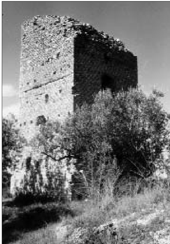
CASTRUM TURRITAE: VEDUTA DELLA TORRE DA N

Se per la prima fase dell'incastellamento laziale le notizie sono frammentarie e mancano gli archivi di importanti fami-