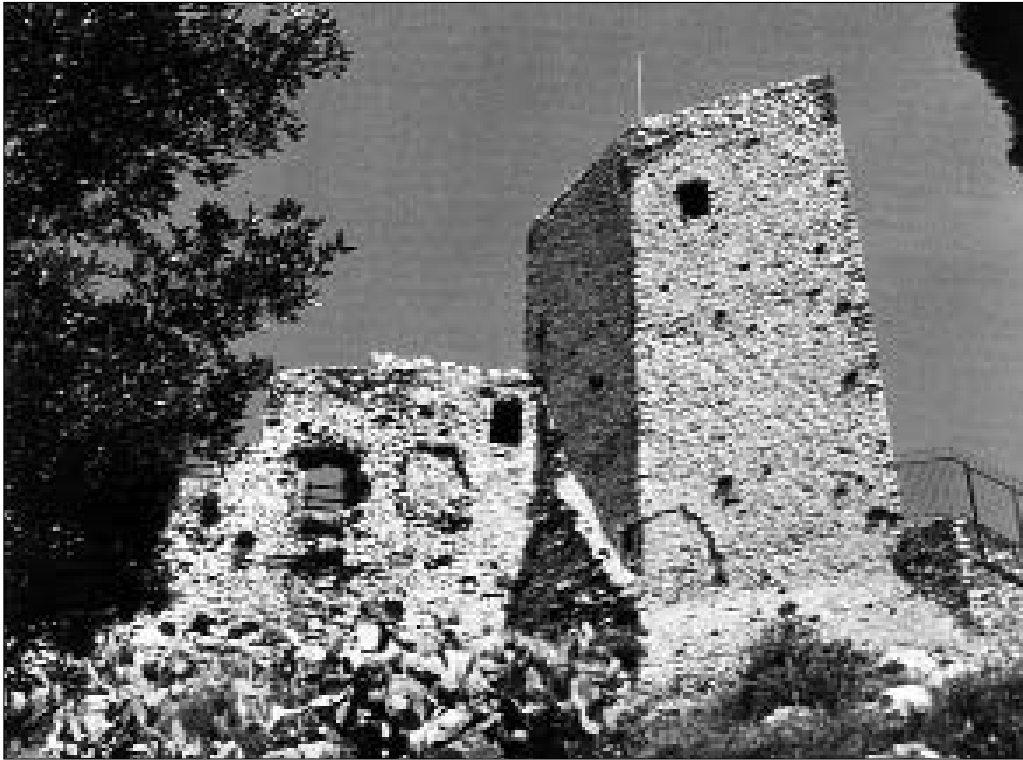
LA ROCCA DI MONTECELIO

contribuire alla manutenzione della fortezza e al mantenimento delle guarnigioni armate.